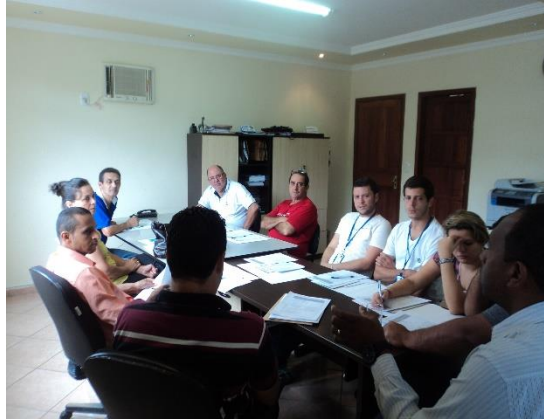
FIGURA 1- REALIZAÇÃO DA OFICINA

Os participantes discutiram e consolidaram as ações necessárias a institucionalizar o PMSB, bem como os indicadores para o acompanhamento e monitoramento, considerando os serviços de abastecimento de água, esgotamento sanitário, limpeza urbana e manejo de resíduos sólidos, drenagem e manejo de águas pluviais urbanas.