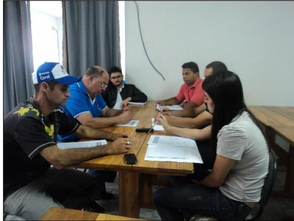
FIGURA 1- REALIZAÇÃO DA OFICINA

Os participantes discutiram e consolidaram as ações necessárias a institucionalizar o PMSB, bem como os indicadores para o acompanhamento e monitoramento, considerando os serviços de abastecimento de água, esgotamento sanitário, limpeza urbana e manejo de resíduos sólidos, drenagem e manejo de águas pluviais urbanas.