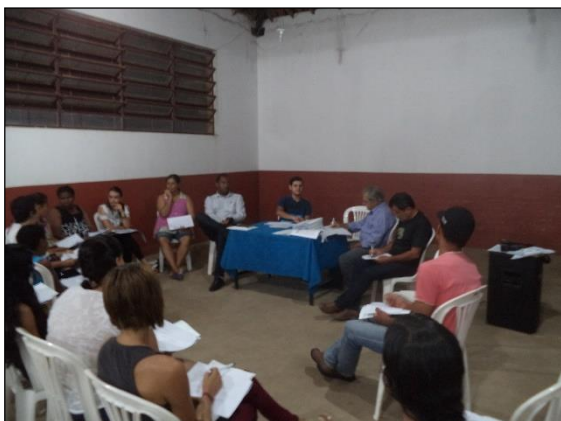
FIGURA 1- REALIZAÇÃO DA OFICINA