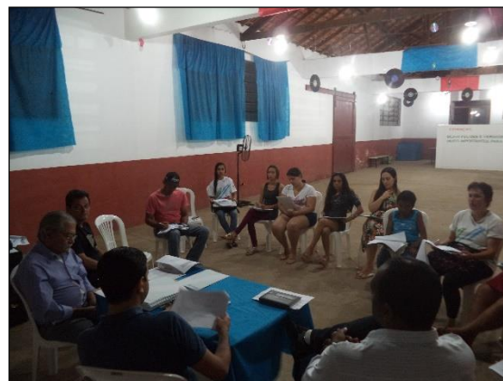
FIGURA 2 - DISCUSSÃO SOBRE OS INDICADORES E ALTERNATIVAS INSTITUCIONAIS PARA GESTÃO

Os participantes discutiram e consolidaram as ações necessárias a institucionalizar o PMSB, bem como os indicadores para o acompanhamento e monitoramento, considerando os serviços de abastecimento de água, esgotamento sanitário, limpeza urbana e manejo de resíduos sólidos, drenagem e manejo de águas pluviais urbanas.