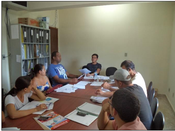
FIGURA 1- REALIZAÇÃO DA OFICINA