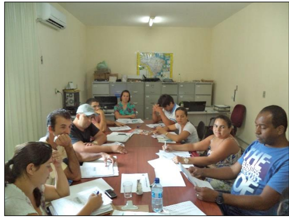
FIGURA 2 - DISCUSSÃO SOBRE OS INDICADORES E ALTERNATIVAS INSTITUCIONAIS PARA GESTÃO

Os participantes discutiram e consolidaram as ações necessárias a institucionalizar o PMSB, bem como os indicadores para o acompanhamento e monitoramento, considerando os serviços de abastecimento de água, esgotamento sanitário, limpeza urbana e manejo de resíduos sólidos, drenagem e manejo de águas pluviais urbanas.