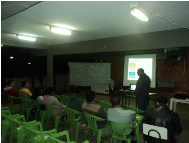
FIGURA 3 - ABERTURA DA OFICINA

Os conceitos apresentados serviram de suporte para que os participantes da oficina pudessem analisar e validar os objetivos e as metas propostos pela consultora (Quadros 3, 4, 5 e 6). Avaliando o diagnóstico e o prognóstico do município, os envolvidos no encontro comunitário puderam interagir com a atual situação do saneamento e determinar aonde se deseja chegar num horizonte de 20 anos (Figura 4).