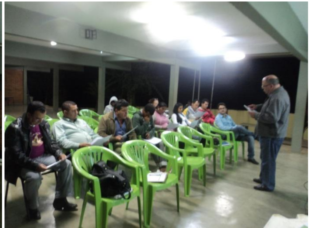
FIGURA 4 - VALIDAÇÃO DOS OBJETIVOS E METAS DO PLANO