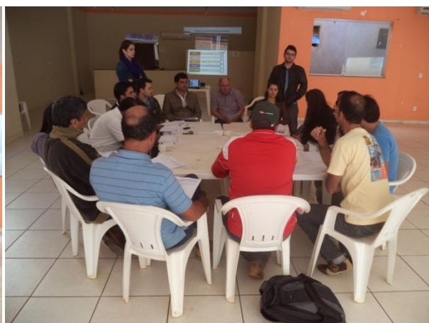
FIGURA 4 - VALIDAÇÃO DOS OBJETIVOS E METAS DO PLANO