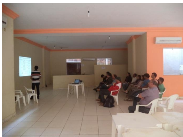
FIGURA 3 - ABERTURA DA OFICINA

Os conceitos apresentados serviram de suporte para que os participantes da oficina pudessem analisar e validar os objetivos e as metas propostos pela consultora (Quadros 3, 4, 5 e 6). Avaliando o diagnóstico e o prognóstico do município, os envolvidos no encontro comunitário puderam interagir com a atual situação do saneamento e determinar aonde se deseja chegar num horizonte de 20 anos (Figura 4).