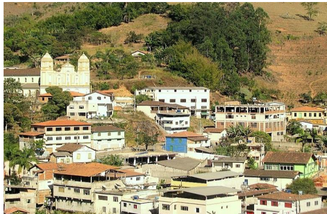
Figura 4 - Vista do município de Diogo de Vasconcelos