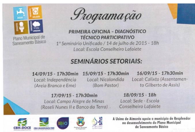
Figura 19 - Verso do convite distribuído em Resplendor