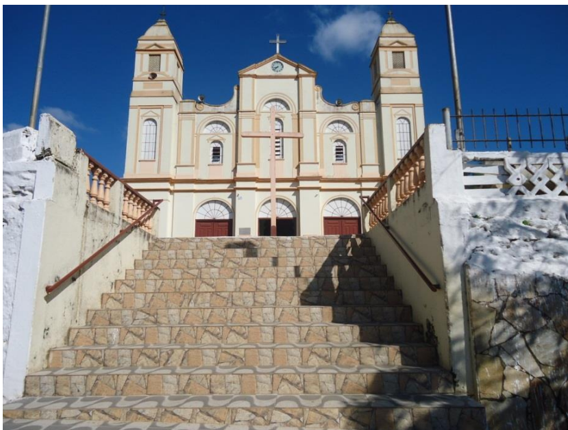
Figura 1 - Igreja em Diogo de Vasconcelos