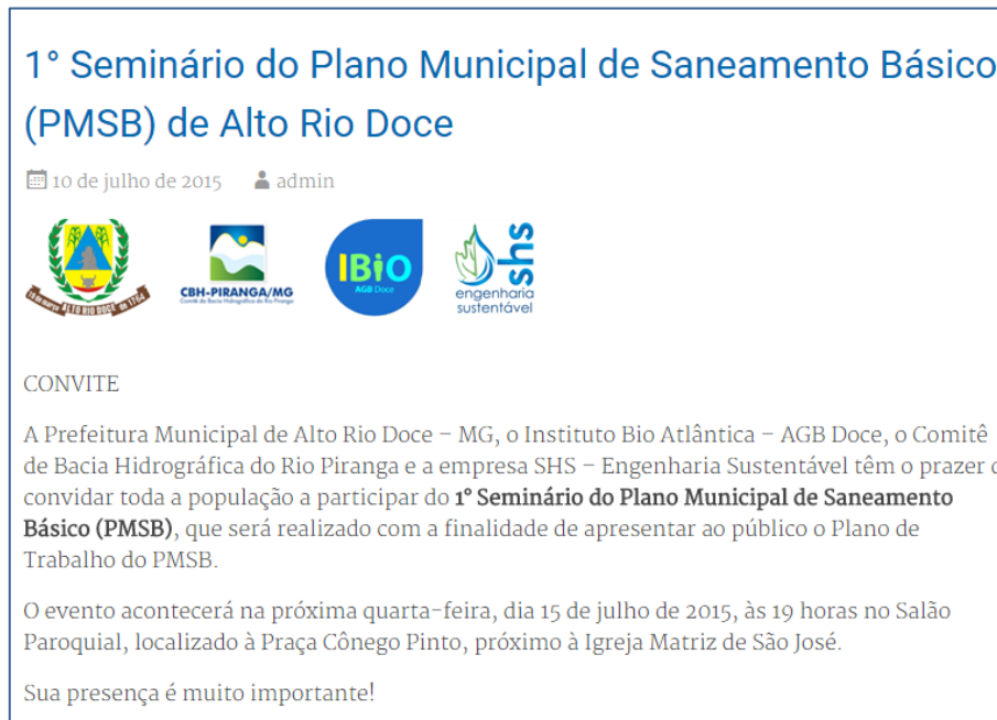
Figura 20 - Convite veiculado pelo município de Alto Rio Doce-MG