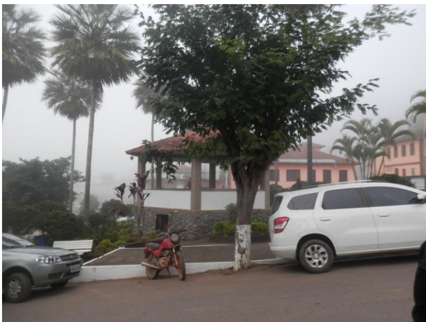
Figura 2 - Praça do Coreto em Diogo de Vasconcelos