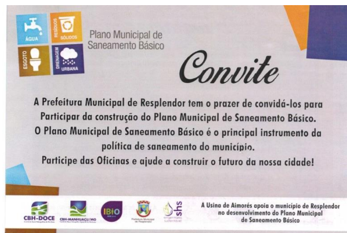
Figura 18 - Frente do convite distribuído em Resplendor

A seguir, é mostrado um exemplo utilizado pela Prefeitura do município de Resplendor e que pode servir de base aos demais municípios contemplados com o PMSB: