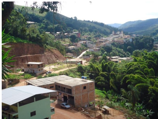
Figura 5 - Vista do município de Diogo de Vasconcelos