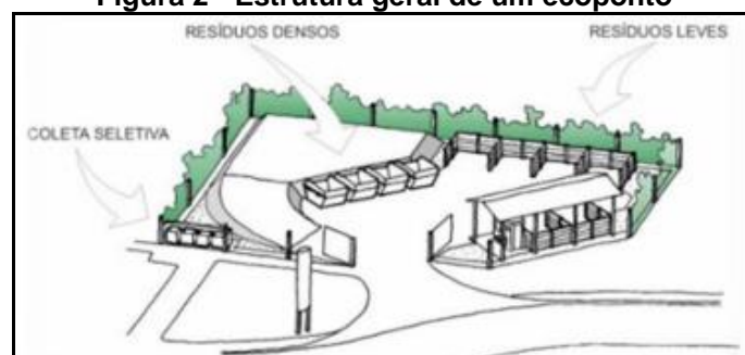
Figura 2 - Estrutura geral de um ecoponto

Para a estruturação desses pontos, as diretrizes para o projeto, implantação e operação, devem estar em consonância com a NBR 15112 (ABNT, 2004), que estabelece normas e fixa requisitos para a criação de áreas de transbordo e triagem. A Figura 2 mostra o modelo da estrutura geral de um ecoponto.