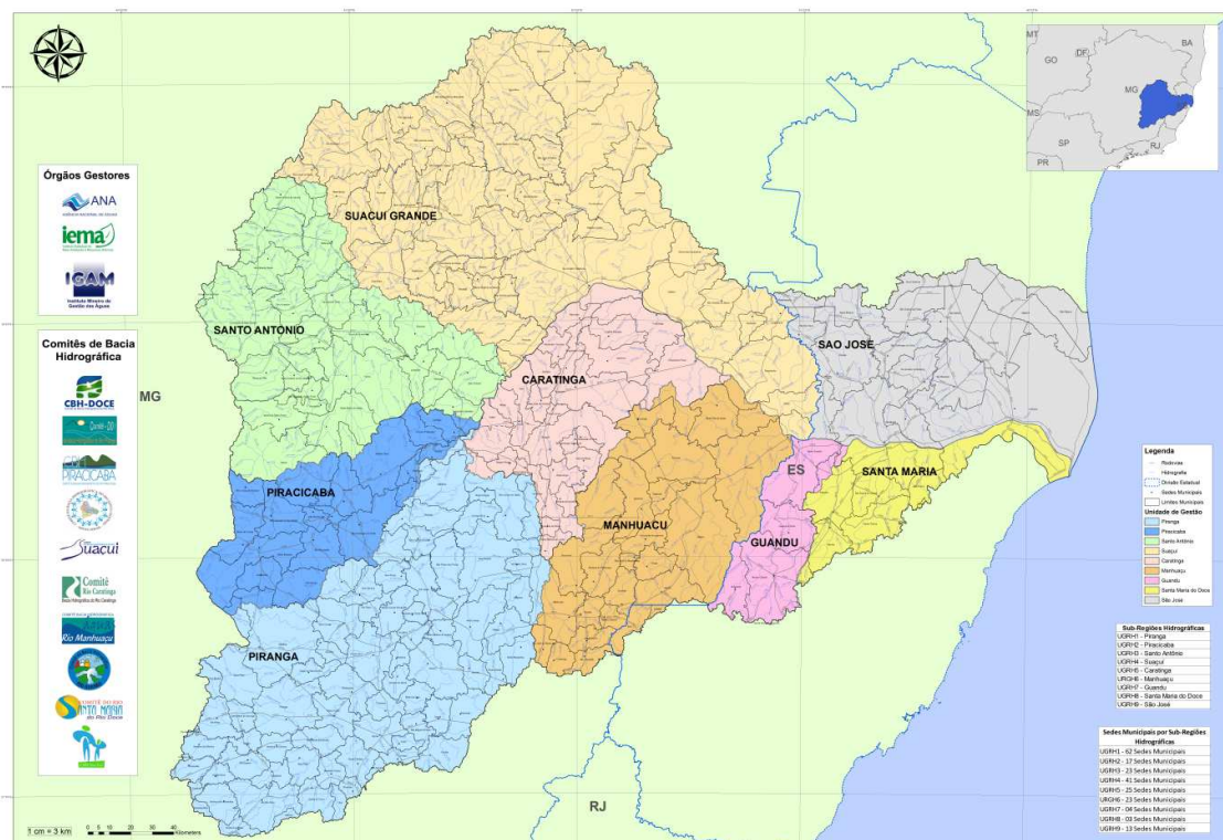
Figura 1 - Localização da bacia do rio Doce

As nove unidades estaduais de gestão de recursos hídricos (UGRHs) da bacia contemplam as UGRH1 Piranga; UGRH 2 Piracicaba; UGRH 3 Santo Antônio; UGRH 4 Suaçuí; UGRH 5 Caratinga e UGRH 6 Manhuaçu, em Minas Gerais, e três no Espírito Santo, correspondente às UGRH 7 Guandu; UGRH 8 Santa Maria do Doce e UGRH 9 São José.